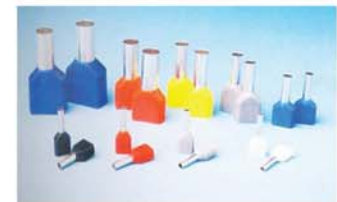
สลีปย้าปลายสายหุ้มฉนวนในลอนแบบคู่