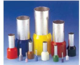
สลีปย้าปลายสายหุ้มฉนวนในลอน