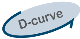
iC60N ชนิด D-curve