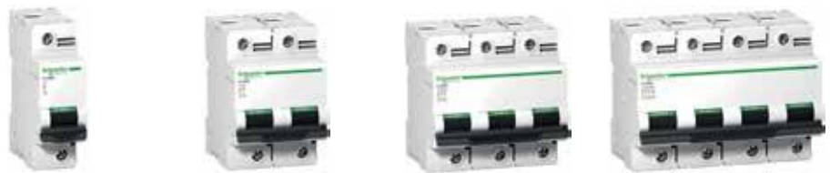
C120N ชนิด C-curve