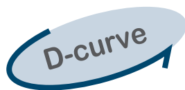
C120N ชนิด D-curve

ค่า breaking capacity (Icu) 6kA@400VAC ตามมาตรฐาน IEC 60898-1