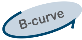
iC60H ชนิด B-curve