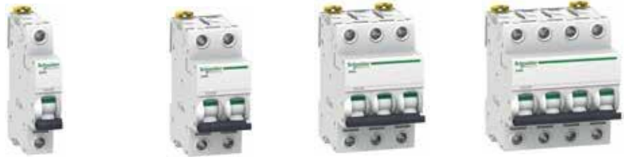
iC60N ชนิด C-curve