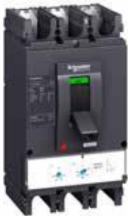
EasyPact CVS ขนาด Frame 400 - 630A