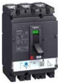
EasyPact CVS ขนาด Frame 100 - 250A