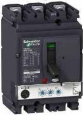
ComPact NSX ติดตั้งพร้อม Trip unit รุ่น Micrologic 2